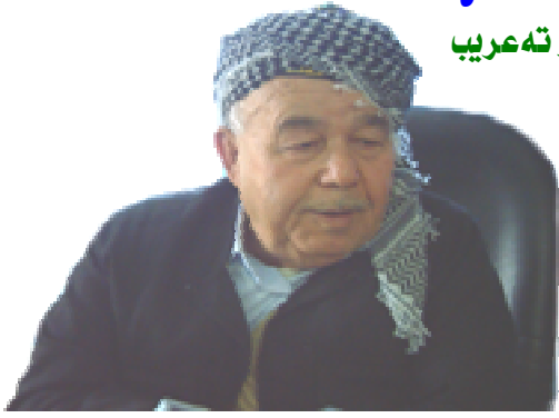
مه لا عهزیز مه خموری

رؤژنامه یه کی رؤشبری گشتیه ، له مه خمور دهرده چیت نرخ (۲۵۰) دینار دوشه مه مه ۲۰۰۸/۱۲/۱۵ ۲۴ سهر ماوهزی ۲۷۰۸ (ژماره ۳)