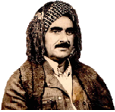
مهلا سالتج بايز