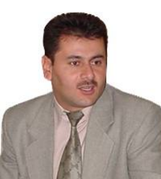
بازران سه يد كا كه

ده رباري قه ره بووي ماده دي ۱۴۰ بازاران سه يد كا كه قايقامي قه زاي مه خمور به (دهنگي مه خموري) راگه يانسد "سه بارت به قه ره بوو كردنه وه ي ماده دي ۱۴۰ واپرياره له سه رهاي سالي نويته وه بدرت چونكه نيستا كه بري ۲۰۰ ميليون دؤلار بؤ ماده دي ۱۴۰ ته رخانكراوه".