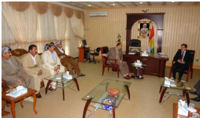
جيگري سه روكي په رله مان پيشوازي له خه لكي مه خمور ده كات (دهنگي مه خمور)

سه بارت به سرداني شاندي مه خمور بؤ په رله مان و بهرنامه ي په رله مان بؤ چاره سره كردني گرفته كان، غه فور مه خموري نه ندامي په رله ماني كوردستان به (دهنگي مه خموري) راگه يانسد "شاندي مه خمور هاتنه په رله مان و گرفته كانيان خسته ورو، باسيان له مه زولو ميه تي ده قهره كه كردو داواكانيشيان به هه ند وهره گرين و كاري له سر ده كه بين و له رتي ليژنه تاييه ت و پيروه نديداره كاني په رله مان به دواي گرفت و كيشه كانياندا ده چين و هه ورتي چاره سره كردنيان ده ديسن"، هه وره ها كوتي "خه لكي ده قهره مه خمور خه لكيكي ولايتپاريزو تيكز شهن و به دريژاي ميژوو نه و نارچه يه مه غدور بووه و خزمه ت نه كراوه، بويه پيويسته به هه موو لايه كمان هه ورتي به ديه ن كيشه كانيان چاره سره كرين و خزمه تيان بكه ين."